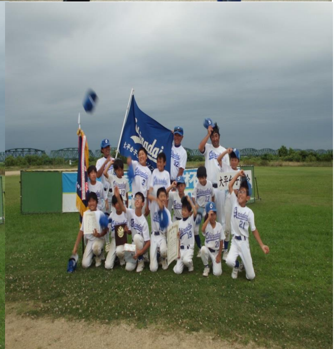
優勝 白脇地区子ども会合同ソフトボール部 準優勝 大平台子供会ソフトボール部