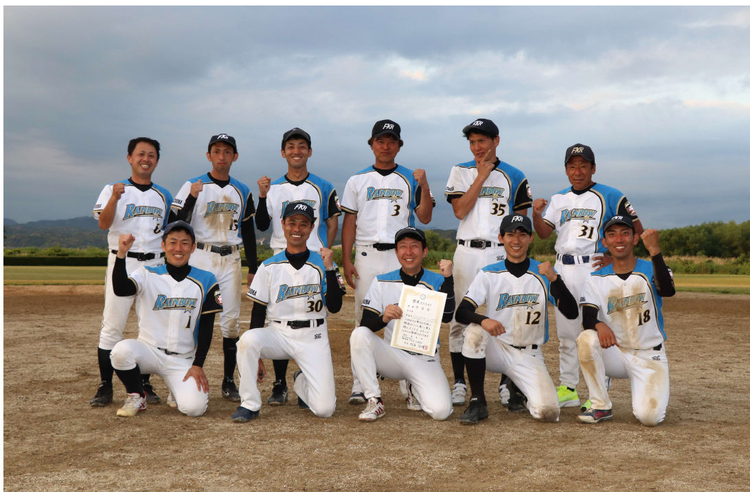
準優勝 富士宮教員レインボー