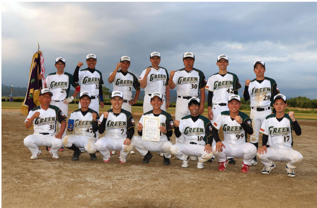
優勝 富士教員グリーン