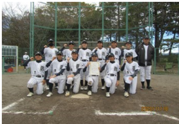
第3位 菊川市立菊川西中学校