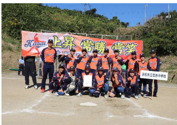
□3位 浜松市立笠井中学校