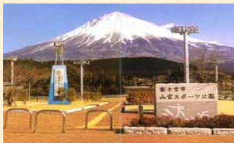
富士山の映像 (静岡県富士宮市)