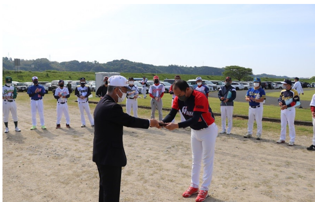
優勝レプリカ（壮年浜松クラブ）