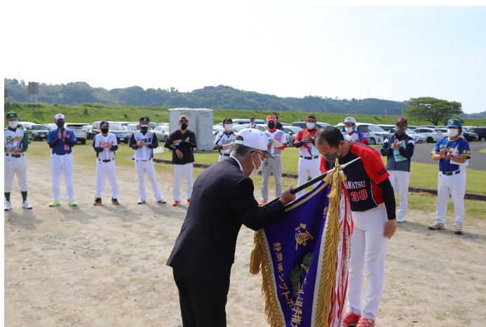
優勝旗返還（壮年浜松クラブ）