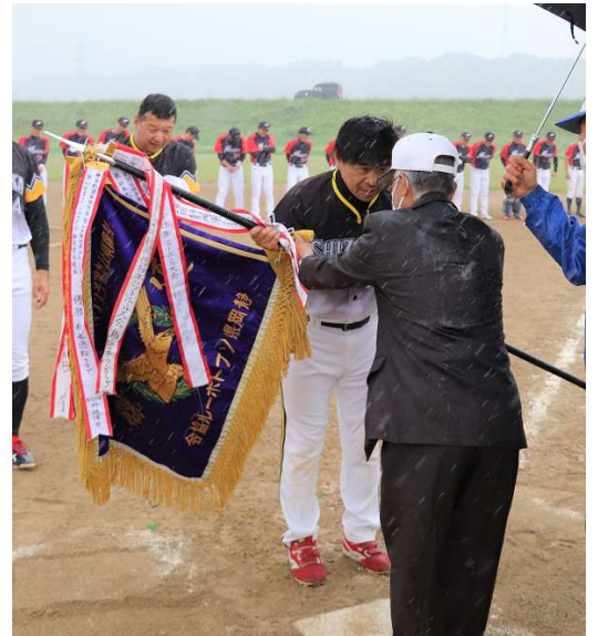
準優勝 壮年浜松クラブ