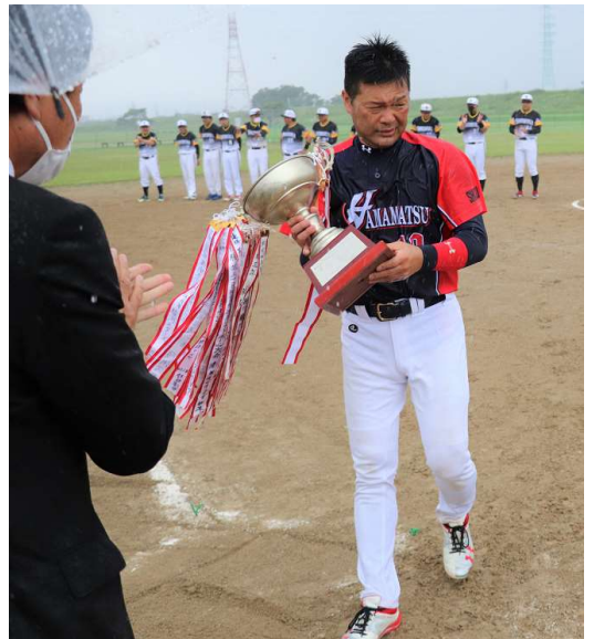
第3位 鳥坂ブルーワンクラブ