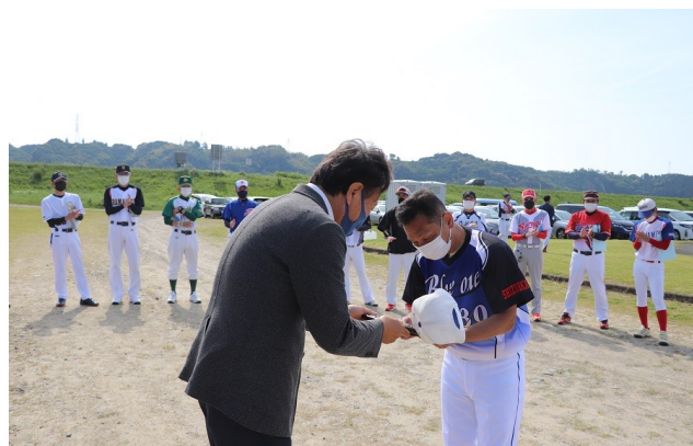
準優勝レプリカ（鳥坂ブルーワンクラブ）