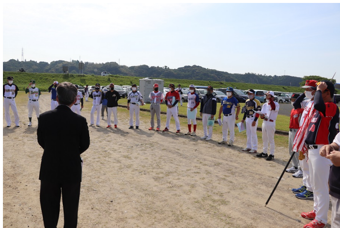
監督会議に臨む参加 20 チーム