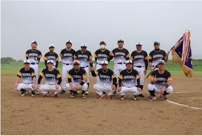
優勝 静岡クラブ壮年