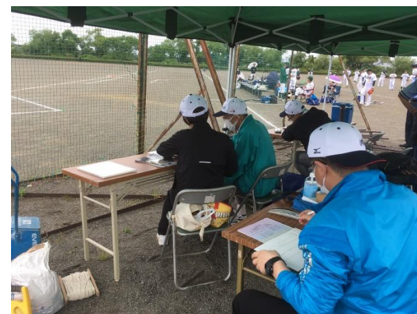
令和3年5月23日 文責 焼津支部 記録委員会