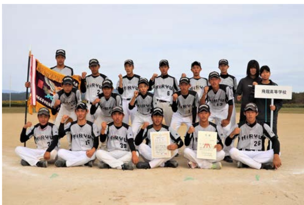
優勝 (男子の部) 飛龍高等学校