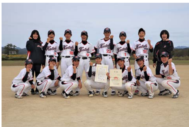
準優勝 (女子の部) 加藤学園高等学校