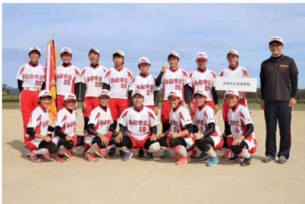
優勝 (女子の部) 浜松市立高等学校